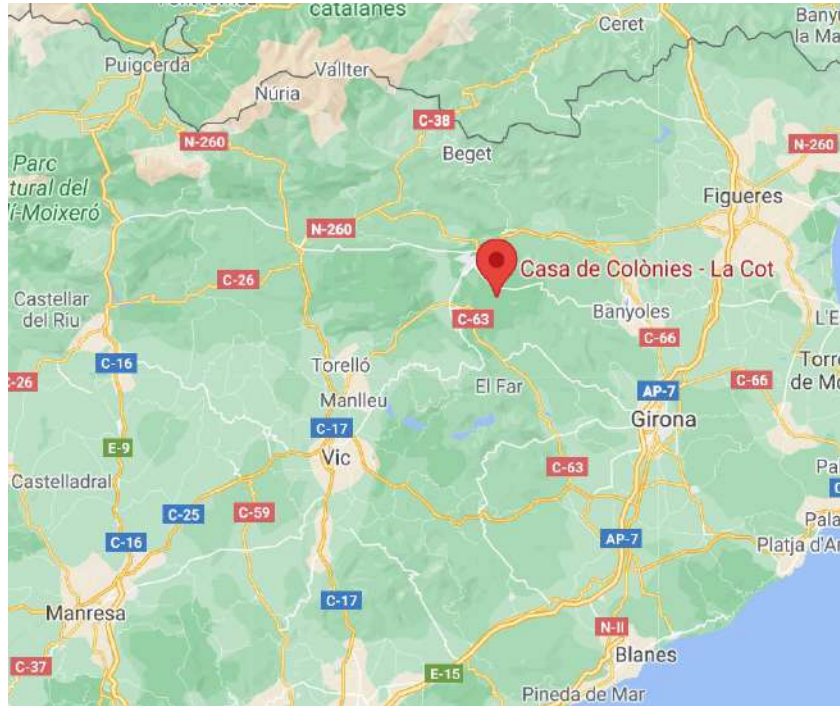
La Cot, 17811 Santa Pau, Girona